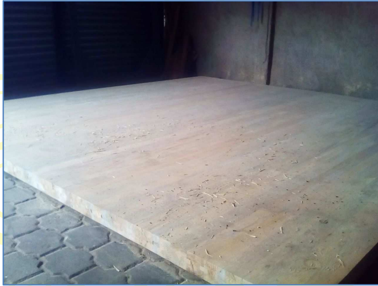
Fabricación de tarimas para entrenamiento de levantamiento de pesas, conformada de piezas de madera de 4 pulgadas x 4 pulgadas x 2.44 metros.

El proyecto consiste en la construcción de 14 tarimas para el entrenamiento de levantamiento de pesas con dimensiones de 2.44 mts. x 2.44 mts., así como la construcción de una tarima para competencias oficiales (desmontable) con dimensiones de 4.00 mts x 4.00 mts.