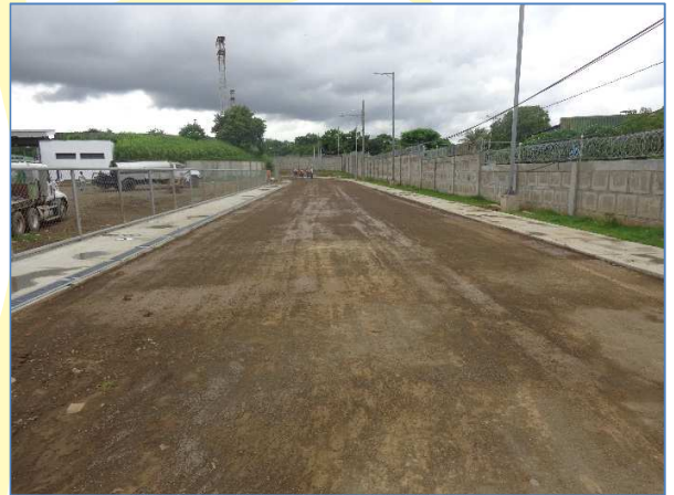
Panorámica de la pista de calentamiento donde se aprecia la aplicación de la primera mano de imprimación de asfalto, iluminación y andenes.

En el mes de junio 2017 se tiene un avance del 79.01%, en la ejecución de construcción de top de lavamanos, imprimación de asfalto y obras exteriores en la pista de atletismo; construcción de bancas móviles para jugadores de fútbol; continuación del enchape de azulejos en paredes.